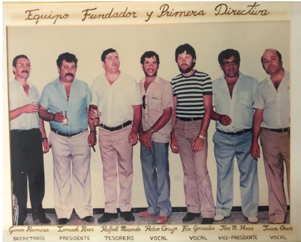
EQUIPO FUNDADOR EN 1980