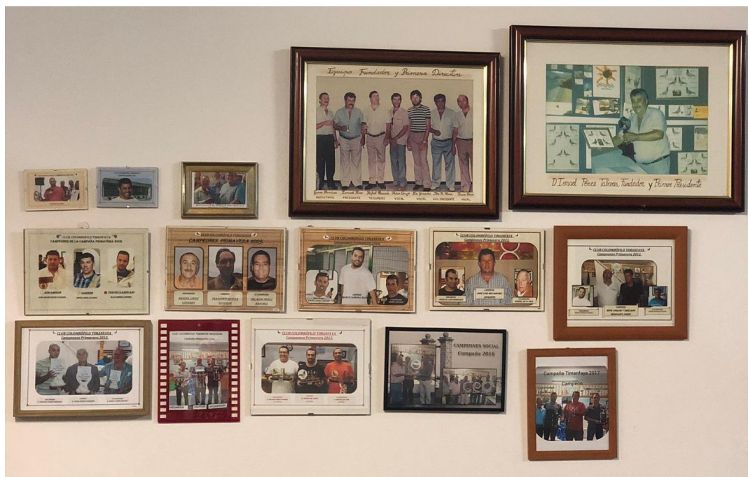
CUADRO DE CAMPEONES